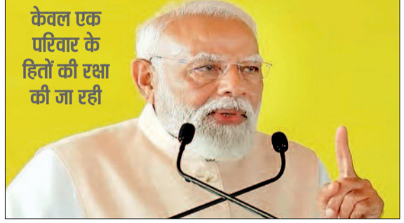
केवल एक परिवार के हितों की रक्षा की जा रही

नेताजी सुभाष चंद्र बोस की जन्म-जयंती के अवसर पर मद्दुरंतकम पहुंचे प्रधानमंत्री ने अपने संबोधन की शुरुआत नेताजी और तमिलनाडु के स्वतंत्रता सेनानियों को नमन करते की। प्रधानमंत्री ने डीएमके सरकार पर तीखा हमला करते हुए उसे 'सीएमसी सरकार' करार दिया, जिसका अर्थ उन्होंने 'करप्शन' (भ्रष्टाचार), 'माफिया' और 'क्राइम' (अपराध) बताया। पीएम मोदी ने कहा, 'जनता ने डीएमके को दो बार स्पष्ट जनदेश दिया, लेकिन उन्होंने इस भरोसे को तोड़ दिया। आज तमिलनाडु में केवल एक परिवार के हितों की रक्षा की जा रही है'। उन्होंने राज्य में बढ़ते ड्रग माफिया पर गहरी चिंता व्यक्त करते हुए कहा कि स्कूलों और कॉलेजों को निशाना बनाया जा रहा है, जिससे माता-पिता अपने बच्चों के भविष्य को लेकर डरे हुए हैं।