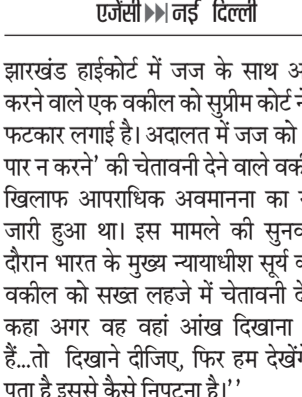
विना शर्त माफी मांगें वरना ... : सीजेआई

वकील पर भड़के सीजेआई, बोले- 'अगर वे आंख दिखाना चाहते हैं तो दिखाने दीजिए, हमें पता है इससे कैसे निपटना है' एनसी नई दिल्ली झारखंड हाईकोर्ट में जज के साथ अभद्रता करने वाले एक वकील को सुप्रीम कोर्ट ने कड़ी फटकार लगाई है। अदालत में जज को 'सीमा पार न करने' की चेतावनी देने वाले वकील के खिलाफ आपराधिक अवमानना का नोटिस जारी हुआ था। इस मामले की सुनवाई के दौरान भारत के मुख्य न्यायाधीश सूर्य कांत ने वकील को सख्त लहजे में चेतावनी देते हुए कहा अगर वह वहां आंख दिखाना चाहते हैं...तो दिखाने दीजिए, फिर हम देखेंगे। हमें पता है इससे कैसे निपटना है।