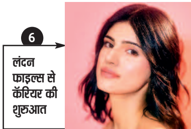
6 लंदन फाइल से कैरियर की शुरुआत