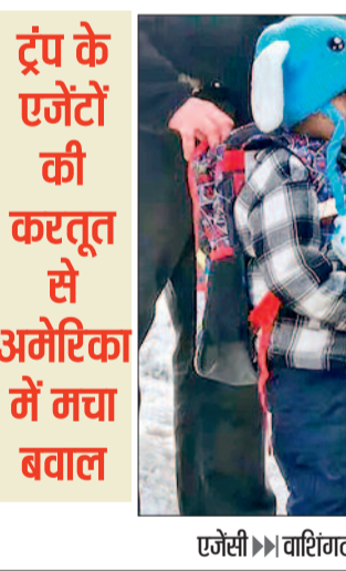
ट्रप के एजेंटों की करतूत से अमेरिका में मचा बवाल