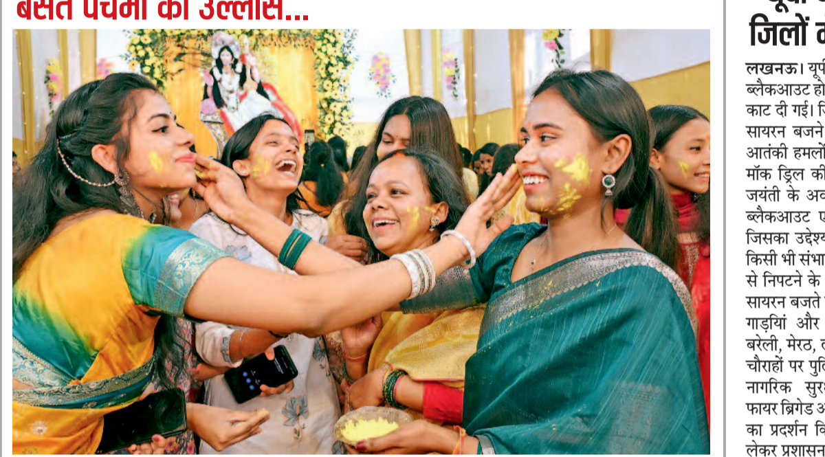
पटना। पटना, बिहार में शुक्रवार को सरस्वती पूजा और बसंत पंचमी के मौके पर छात्र रंगों से खेलते हुए।